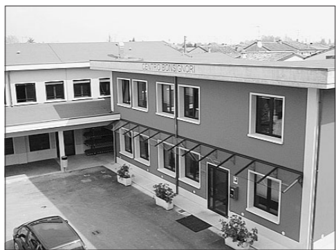
Remedello: l'Istituto Bonsignori

Il ragazzo, che è sereno, tranquillo e di buon umore, è ancora ricoverato nel reparto di Oculistica dell'Ospedale Civile di Brescia e nei prossimi giorni dovrebbe essere sottoposto ad un secondo piccolo intervento chirurgico per la rimozione dei residui della sacca di sangue formatasi nel bulbo oculare. I compagni di classe e di scuola sono molto dispiaciuti per l'involontario incidente. Dispiaciuti per quello che è successo anche i genitori del ragazzo al quale è inavvertitamente sfuggita di mano la penna.