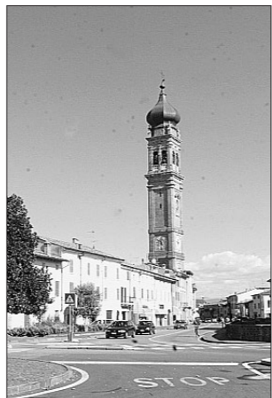
Generosità a Carpenedolo