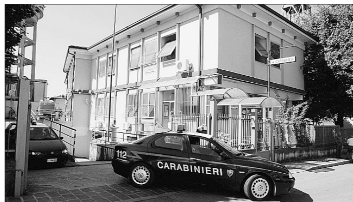
Una pattuglia del Nucleo radiomobile all'uscita dal comando di Verolanova

L'incursione è avvenuta intorno alle 8 alla Motella, in via Casci-